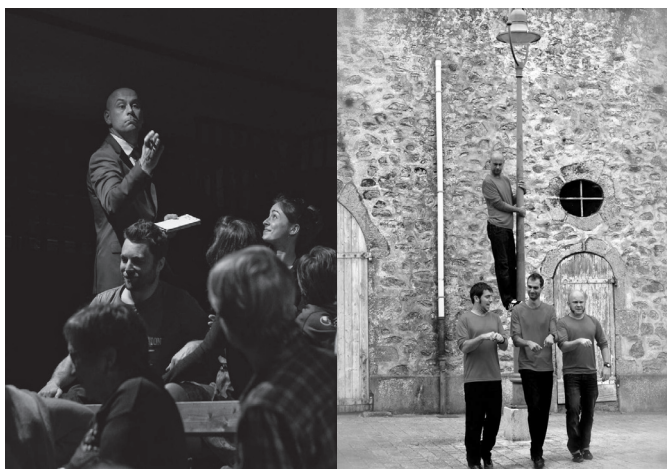
Nos Vies + d'infos

Son travail de transmission lui permet d'intervenir tout aussi bien auprès d'un public amateur que professionnel sous forme de stages ou d'ateliers.